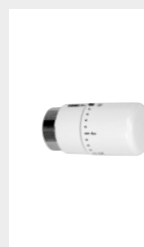
Tête thermostatique à liquide - blanc

Multicouche \varnothing 16 Code 5991990311185