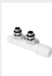
Robinet kristal à équerre entraxe 50 mm droite thermostatisables en blanc R01-RAL 9010

Multicouche \varnothing 16 Code 5991990311160