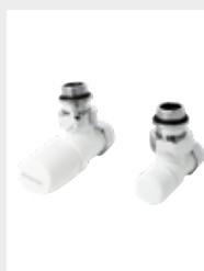
Robinets kristal à équerre thermostatisables en blanc R01-RAL 9010

Cuivre \varnothing 12/14/15 Code 5991990311161