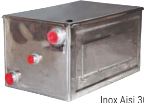
Inox Aisi 304