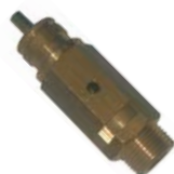
Valvola di sicurezza

Tutte le valvole di sicurezza fornite sono accompagnate da un certificato di conformità CE emesso da Ente Notificato e la loro installazione viene regolamentata dalle norme nazionali sull'esercizio degli apparecchi a pressione (Raccolta E).