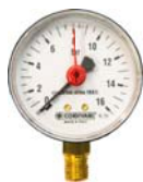
Attacco "ore 6"

Strumenti indicatori di pressione installati su apparecchi a pressione per avere indicazione in ogni momento circa la pressione a cui è sottoposto il recipiente. Tutti i manometri sono forniti con lancetta regolabile di indicazione di massima pressione.